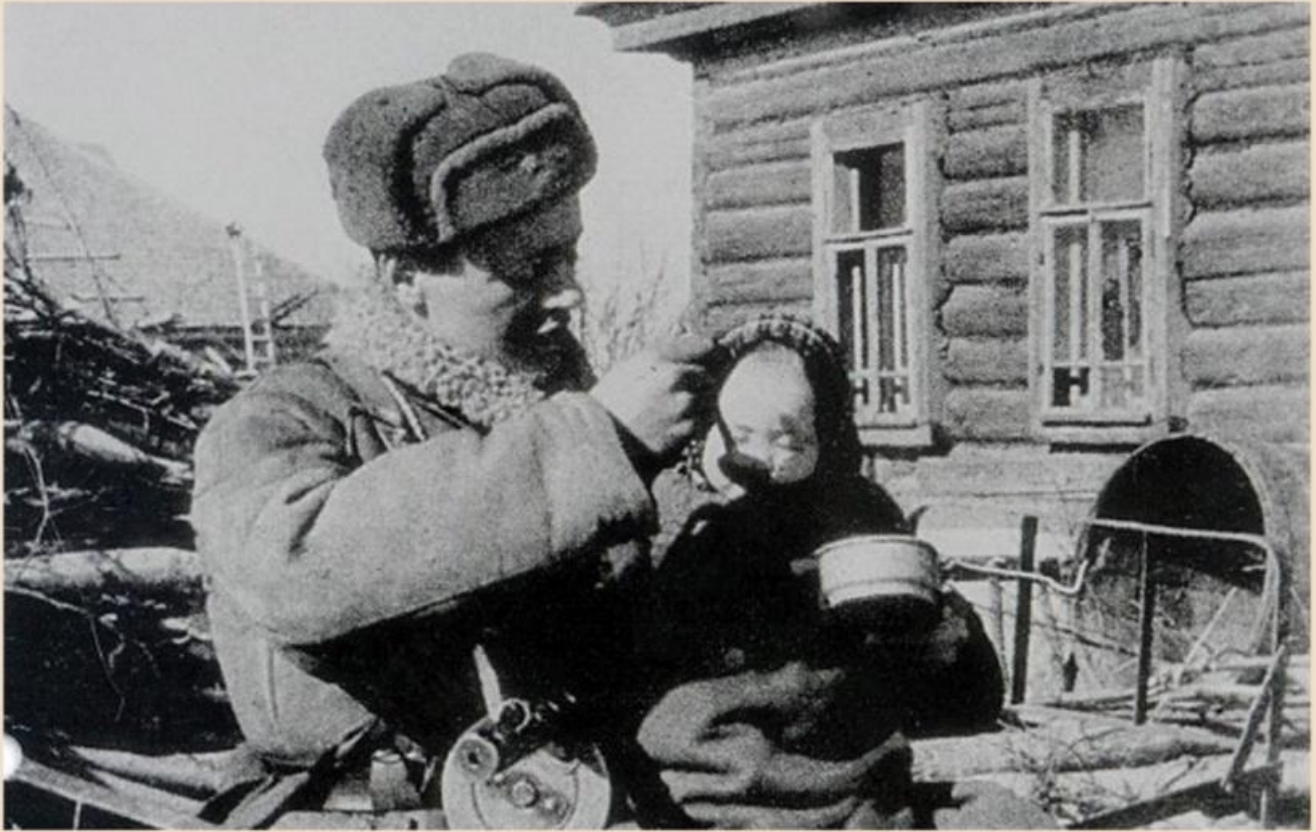
Воин Красной Армии кормит ребенка. Б.л.