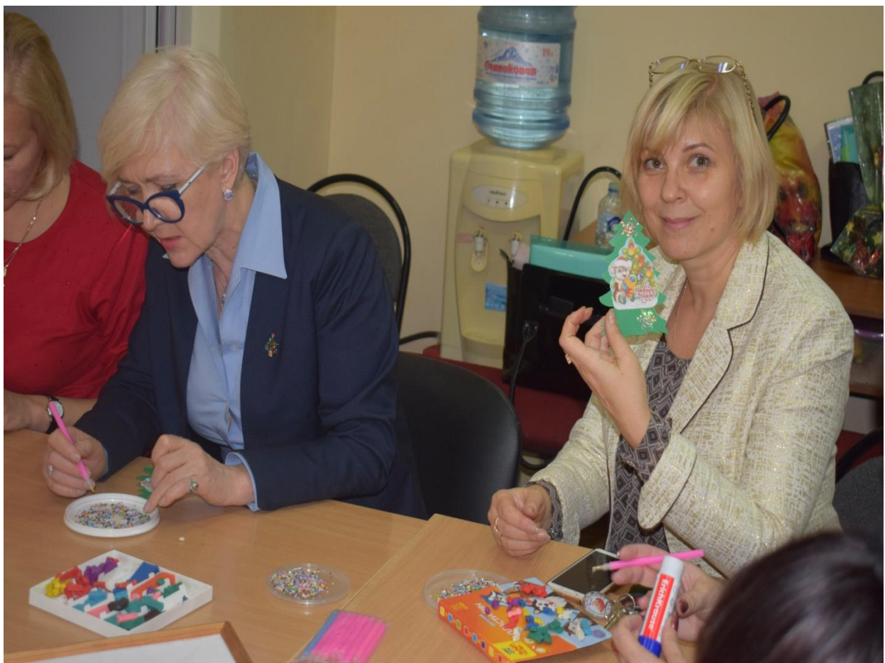
Мастер-классы, элементы открытых занятий