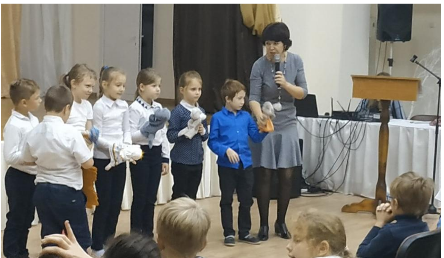
Участие детей в массовых мероприятиях, как одна из форм социализации в процессе инклюзивного образования