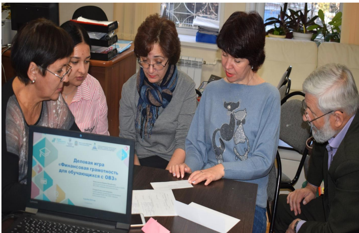
Мастер-классы, элементы открытых занятий