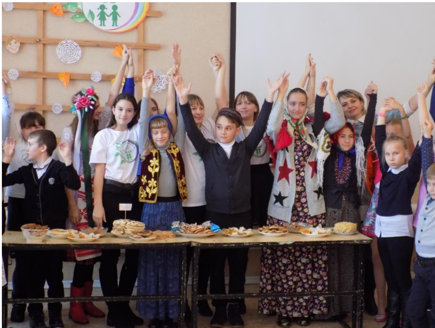
Традиционный Фестиваль «Дети разных народов, мы мечтою о дружбе живём!» объединяет всех ребят!