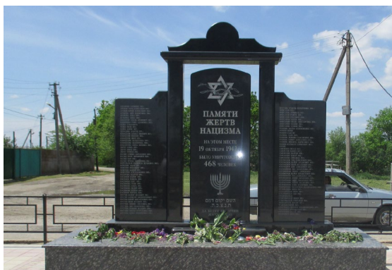
Рисунок 2 Памятник жертва Холокоста в ст. Курской Курского района