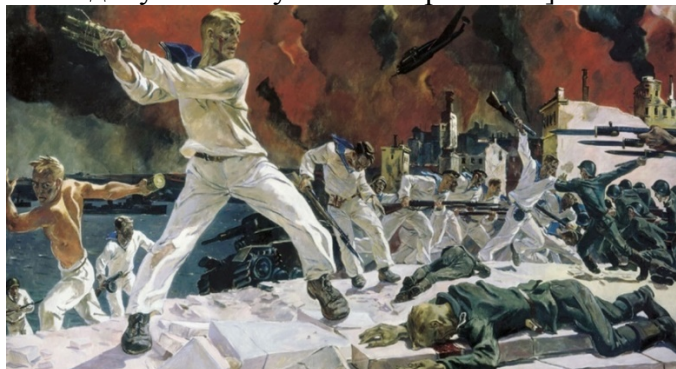
Рисунок 1 – Оборона Севастополя. 1942 г. Художник Александр Дейнека.

Слайд 2. Выполнение заданий по культуре и работа с иллюстративным материалом у многих вызывают сложность (задания №18 ЕГЭ). Ученик должен ответить на приведенные ниже утверждения. Являются ли они верными или же содержат ложную информацию. Для работы на уроке использую разнообразные приемы и методы с визуальным материалом. Ребята готовят на урок по теме «Культура и война» ученические мини-проекты и презентации, рассказывают предысторию и особенностях создания плакатов, карикатур, скульптур, [4.Электронный ресурс. Режим допуска: Решу ЕГЭ история 2021].