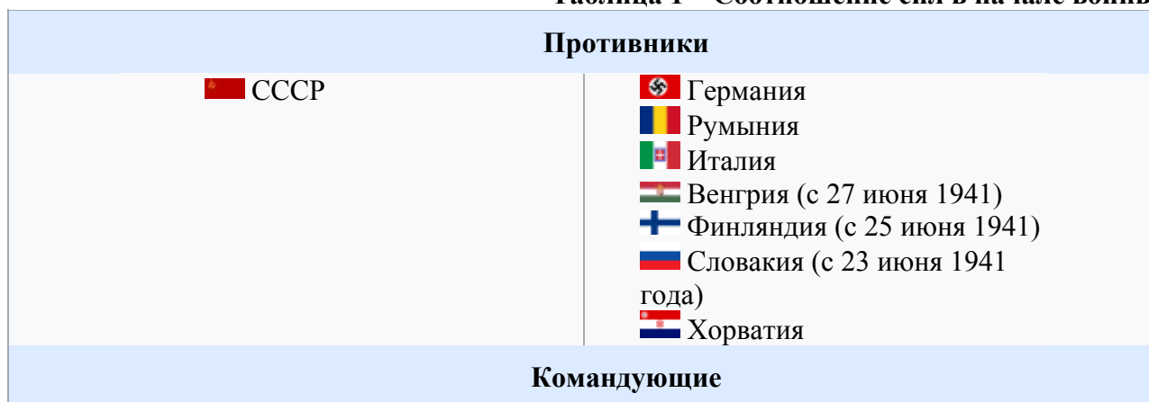
Таблица 1 – Соотношение сил в начале войны

22 июня 1941 года немецкие войска вторглись на территорию СССР и уже в конце сентября стояли у Москвы. Но немецкое командование, несмотря на хорошо продуманную стратегию, не учло несколько важных факторов – это несокрушимый боевой дух русских солдат, офицеров и командующих, ненастные погодные условия, затягивание войны и связанные с этим проблемы с поставкой припасов и топлива, большая площадь непроходимой и труднопроходимой местности. Вследствие огромных потерь и жертв в начале войны, перераспределенному командованию в ставке и многому другому русские войска смогли с большим трудом и долей везения не только остановить немецкое наступление, но и перейти в контрнаступление. Битва под Москвой окончательно разрушила план немецкого командования «Барбаросса» по захвату СССР.