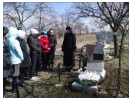
Еврейское захоронение с. Чернолесское «Минута молчания».