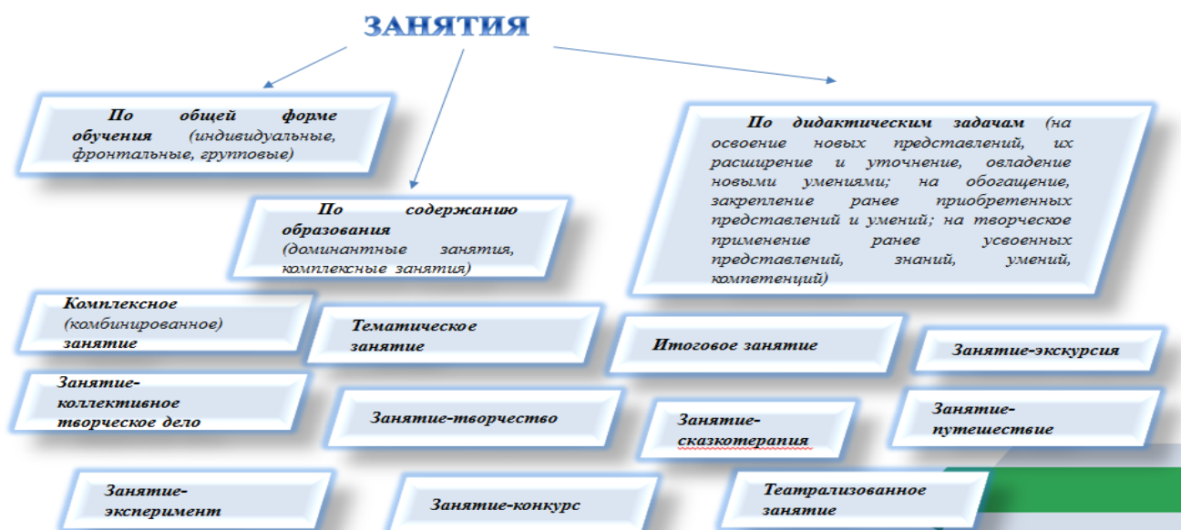
Рис. 3. Виды занятий в дошкольном образовании

В работе с детьми по ознакомлению с особенностями своей малой родины перед педагогом стоят задачи: