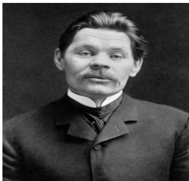
Максим Горький (1868-1936)