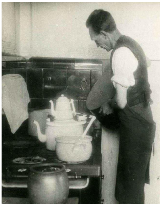
Жизнь русских эмигрантов во Франции