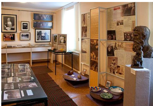
Музей казаков – некрасовцев и молокан в п. Новокумском