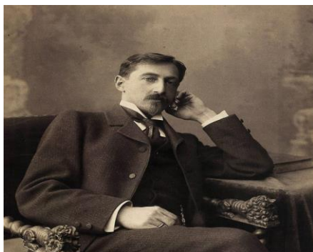
Бунин Иван Алексеевич (1870-1953)