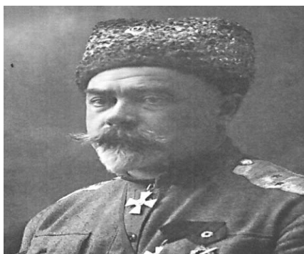
Деникин Антон Иванович (1872-1947)