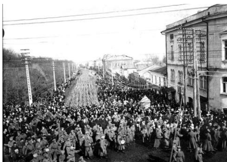
Революция на Ставрополье