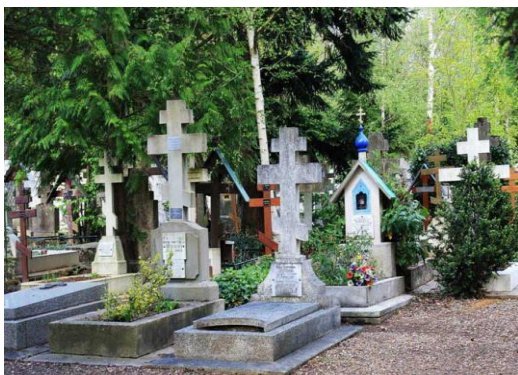
Могилы на кладбище Сен-Женивье – де-Буа под Парижем