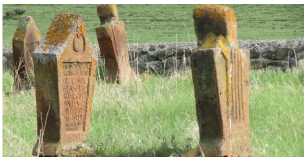
Кладбище в селе Чакмак в Турции