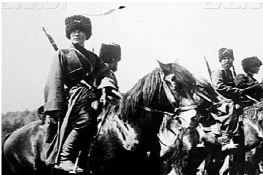
Гражданская война на Ставрополье (1918-1920)