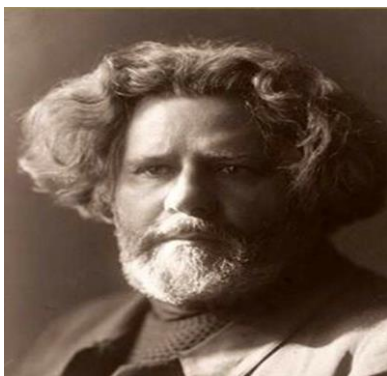
Волошин Максимилиан Александрович (1877-1932)