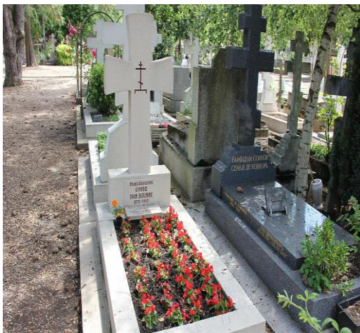
Могилы на кладбище Сен-Женивье – де-Буа под Парижем