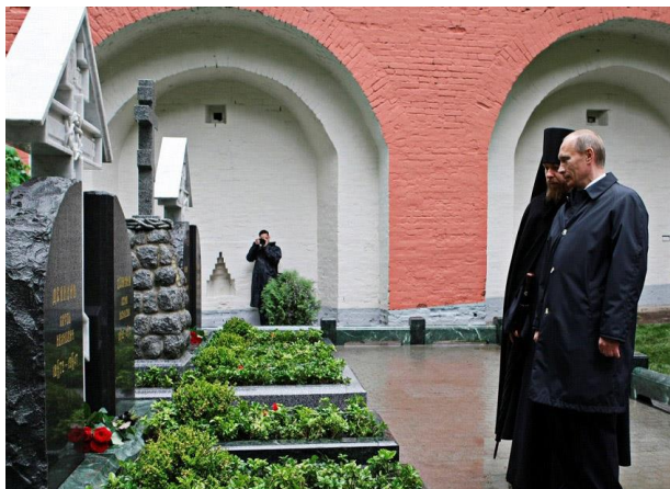
Путин Владимир Владимирович на Донском кладбище, у могилы Ивана Ильина