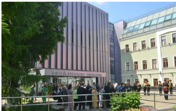
Музей русских эмигрантов в Москве