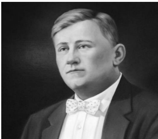
Несмелов Арсений Иванович (1889-1945)