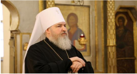
Митрополит Ставропольский и Невинномысский Кирилл