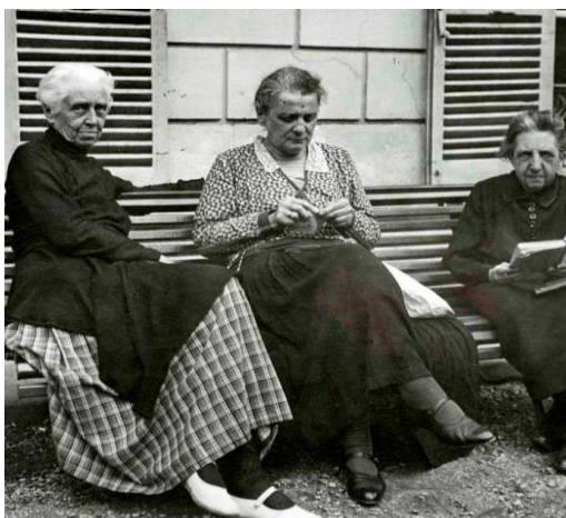
Жизнь русских эмигрантов во Франции