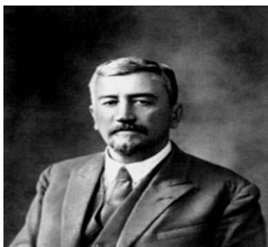
Куприн Александр Иванович (1870-1938)