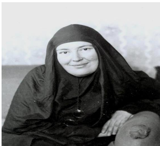
Мария (Скобцова) (1891-1945)