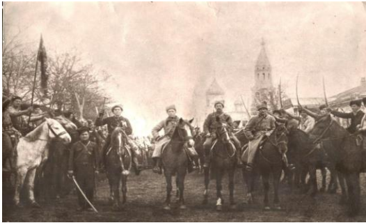
Гражданская война на Ставрополье (1918-1920)